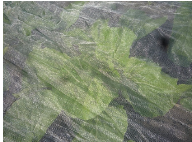
Kinakål dækket med insektnet