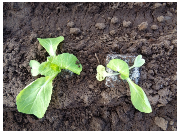
Kinakålsmåplanter i 4 centimeter potte. Kvaliteten af partiet er dårligt, fordi der er stor størrelsesforskel på de enkelte småplanter.