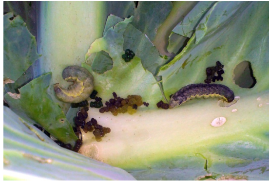
Kåluglelarver og ekskrementer i kålhoved.