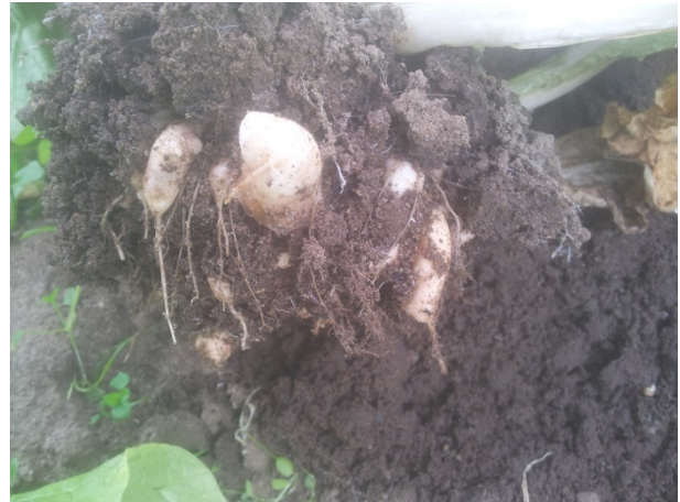
Kålbrot på kinakål.