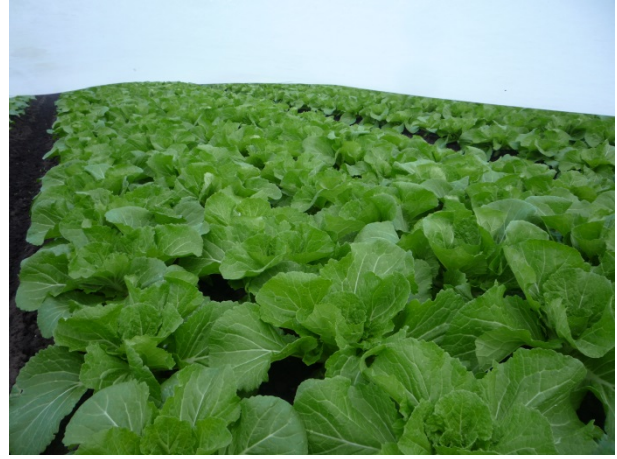
Kinakål på forskellige udviklingstrin – under fiberdug.