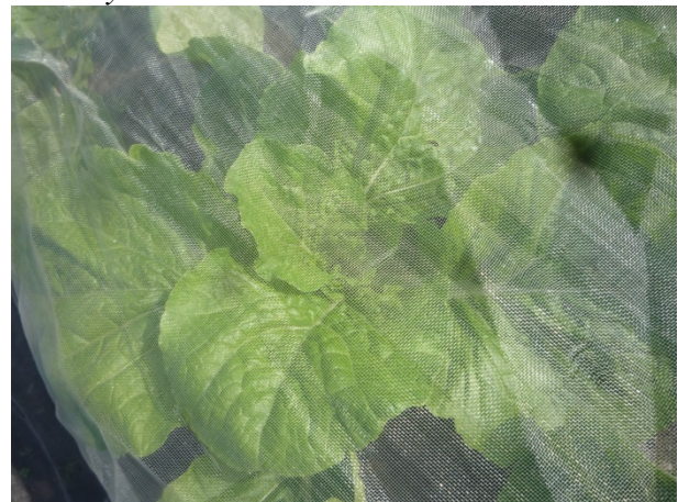
Kinakål, som står lige ved siden af hinanden udækket hhv. dækket.