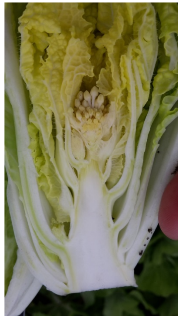
Blomsterdannelse i kinakål.