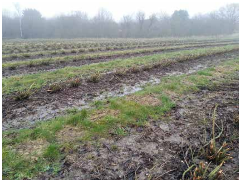
Vandet kan ikke længere dræne væk. Her fra toppen af en lille bakke.

Denne tid hvor alt er vådt, og kørsel i marken ikke er mulig, bør bruges til planlægning samt indkøb af gødning og sprøjtemidler. Eneste arbejdsopgave der kan udføres i marken, er inspektion mod knopgalmider. Og selv dette er umuligt, når det blæser.