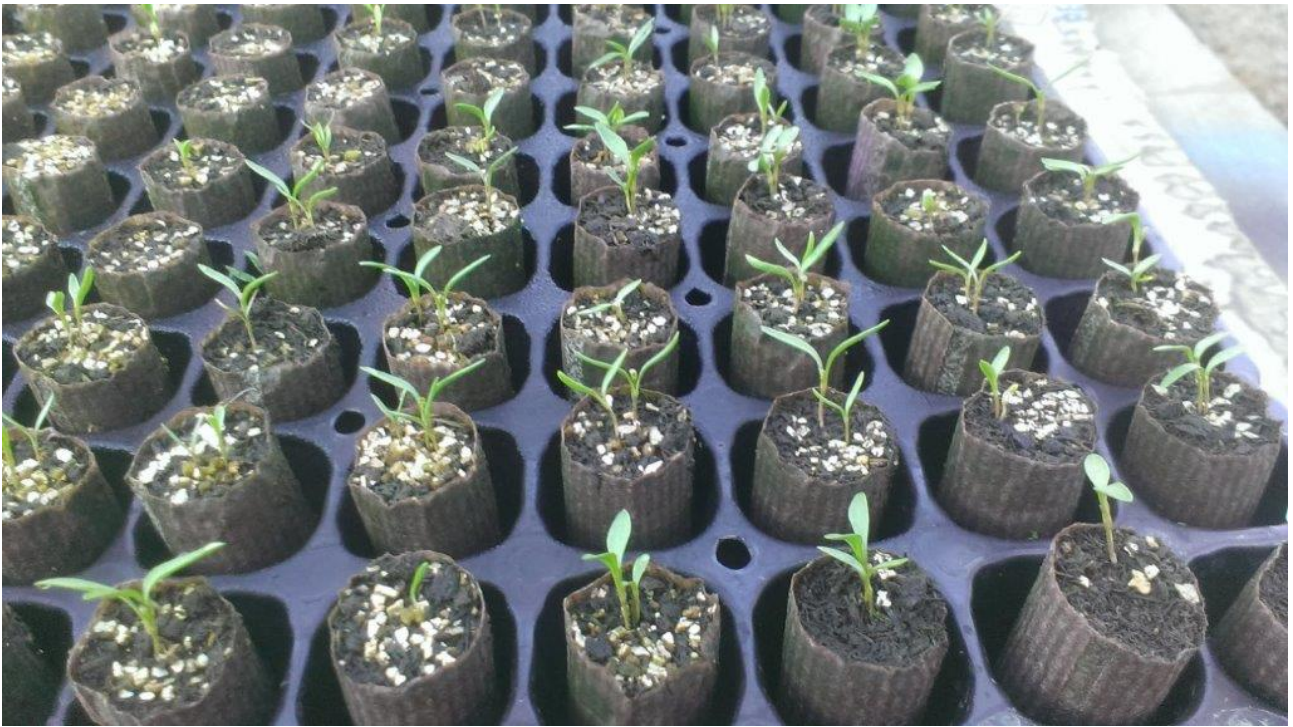
Persillerod i 5 cm's potter som er spiret ud gennem bunden