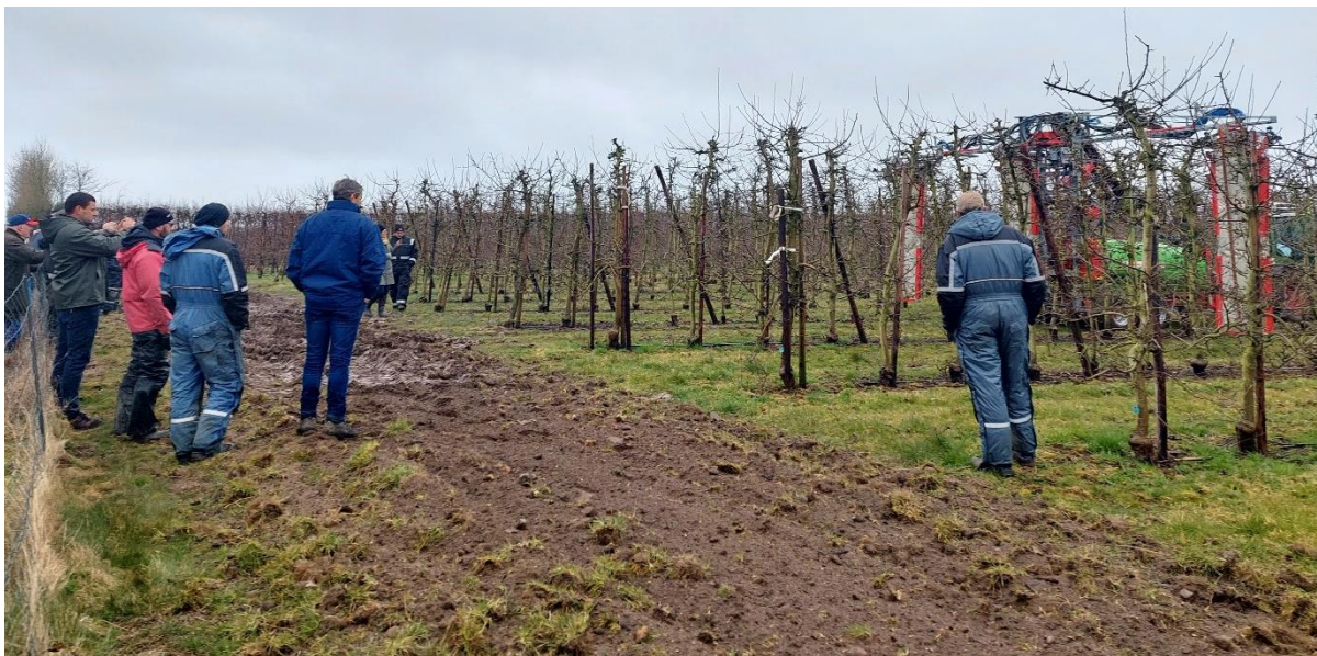
Demonstration of 3-rækket sprøjte.