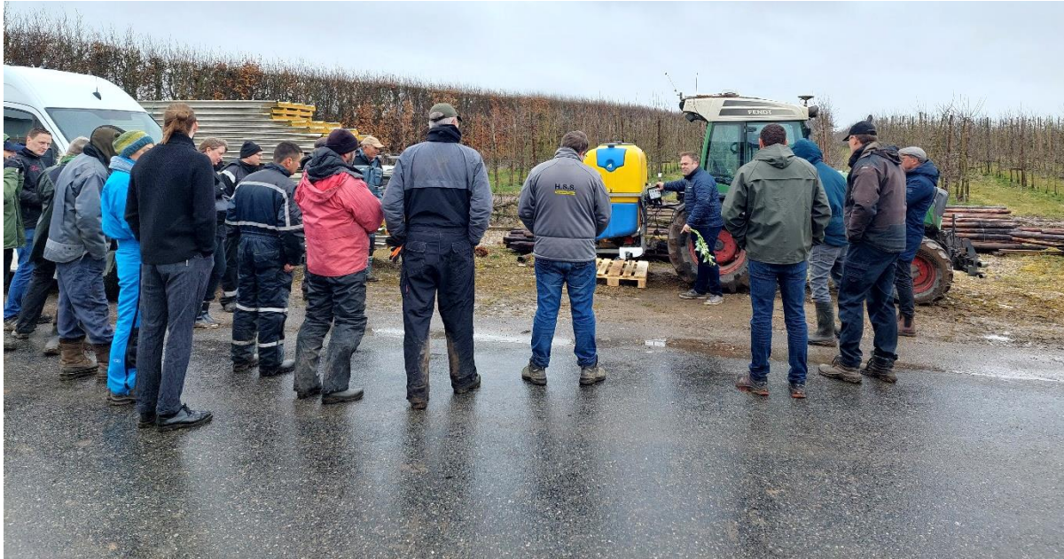
Firmaet Geoteam viste præcisions-ukrudtsbekæmpelse med deres produkt "weedseeker".