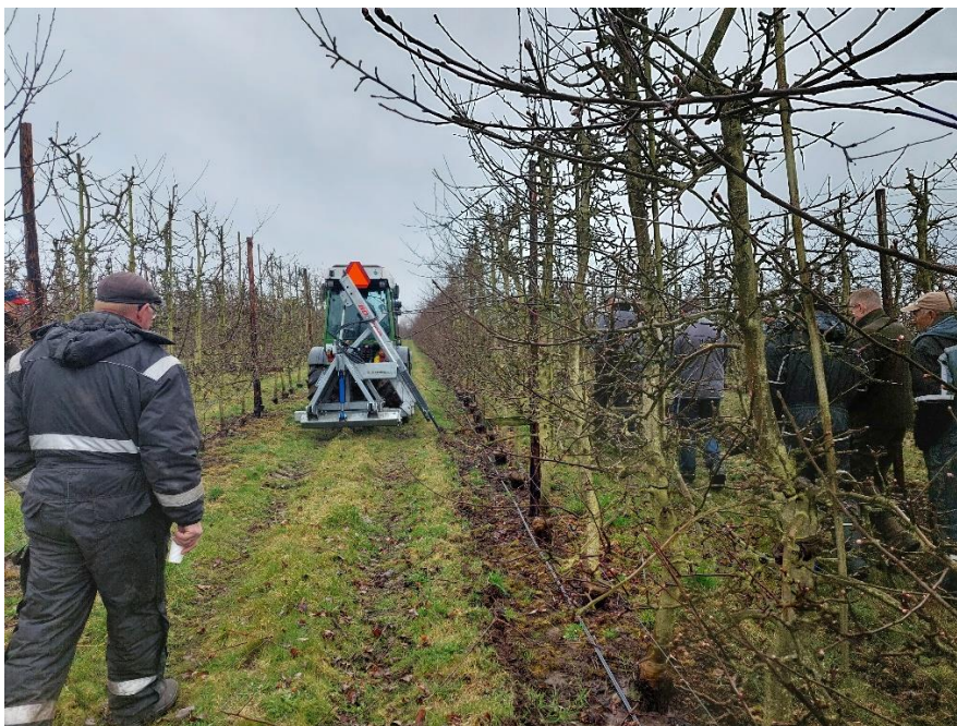
Rodbeskæring på baggrund af dronebilleder.