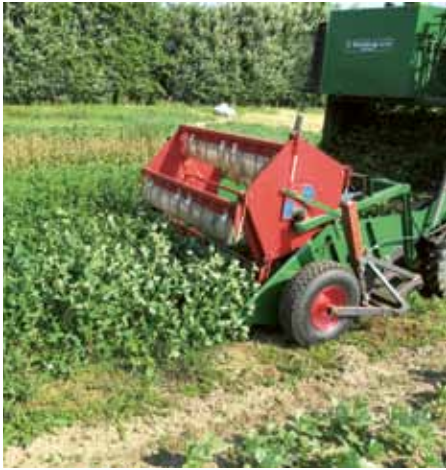
Høst af rødkløver på tidligt udviklingsstadiet.

blev der opnået et kvælstofudbytte på 70-160 kg pr hektar med det største udbytte ved høst på sent udviklingsstadiet (figur 1).